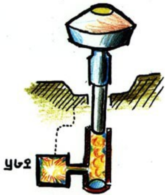
imagen 3 sodio se vaporiza; y la presion hace ascender vivienda