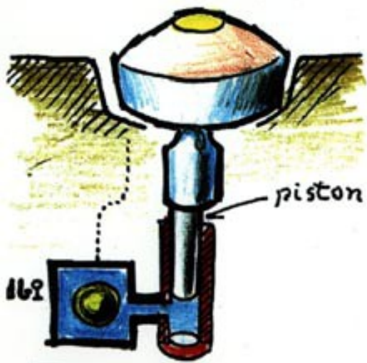
imagen 2 sodio solido; piston descende